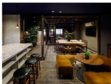
運営：UNKNOWN 京都有限責任 事業組合（株式会社 OND 他）