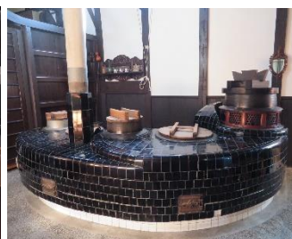
写真: 荒川邸 (京都市北区)