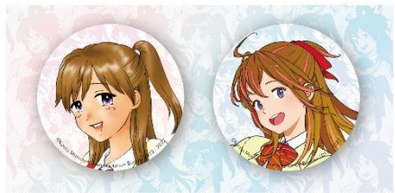
【缶バッジ・台紙イメージ】

ウ “地下鉄に乗るっ” 「地下鉄烏丸線20系」クリアファイル 新作 大人気！今春運行開始された地下鉄烏丸線20系PRポスターがデザインされたクリアファイルです。