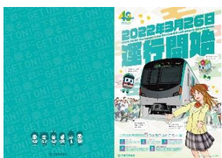
【クリアファイル イメージ】