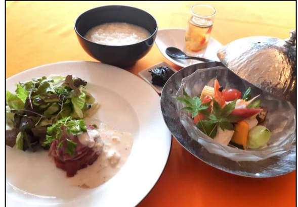
<京のゆば粥御膳～フレンチスタイル～> ラタトゥイユと牛肉のサラダ仕立て ～湯葉ドレッシング添え～