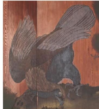
杉戸絵《松鷹図》の鷲