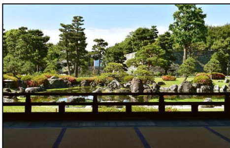
清流園・香雲亭から見た庭園の眺め