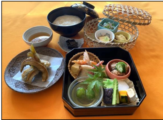
<季節の逸品付き京のゆば粥御膳> ※季節の逸品例：鮎の竜田揚げ