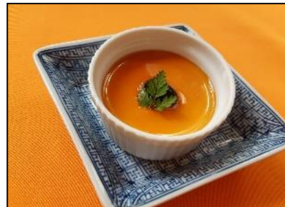
デザート (平日限定サービス) ※一例：自家製豆乳プリン