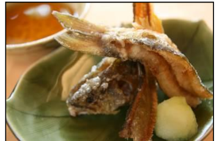
鮎の竜田揚げ (8月16日～31日)