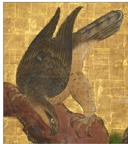
「大広間四の間」《松鷹図》の鷲・鷹