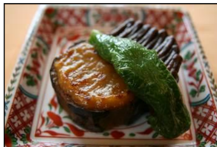
賀茂茄子田楽 (8月1日～8月15日)