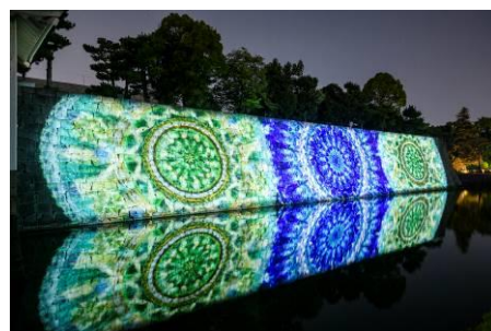
昨年のデジタル花火の様子