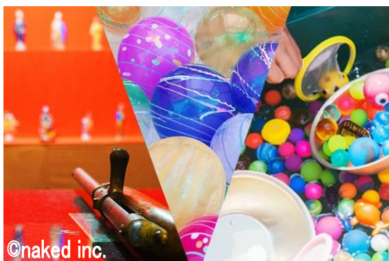
縁日屋台(イメージ)