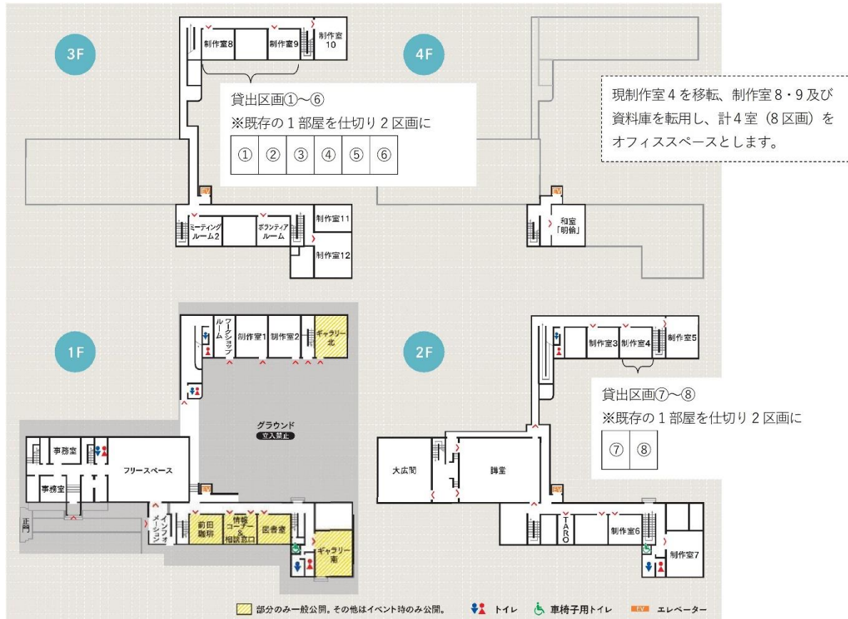
芸術センター館内図芸術センター館内図