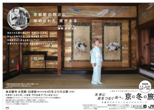
J R グループの各駅・車内で展開するポスターの一例 ※画像はイメージです