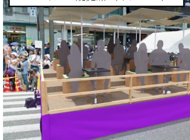
プレミアム観覧席（イメージ）