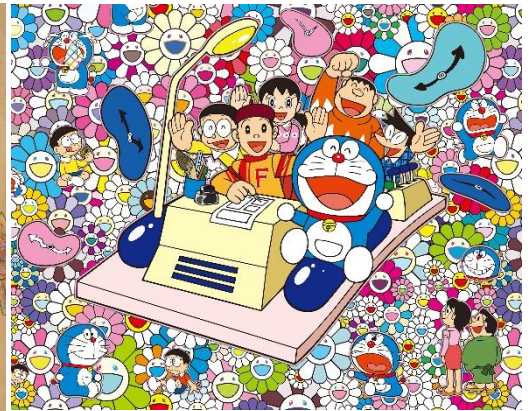
村上隆《あんなこといいな 出来たらいいな》（部分） ©2017 Takashi Murakami/Kaikai Kiki Co., Ltd. All Rights Reserved. © Fujiko-Pro

京都市京セラ美術館は2020年5月に約3年にわたる休館を経てリニューアルオープンし、来年2年目を迎えます。開館1周年記念展として、本館では、京都が誇る日本画家「上村松園」の個展を2021年7月より開催いたします。新館・東山キューブでは、京都の建築物をモダンの側面から再考する「モダン建築の京都」を2021年9月より開催し、展示室内の展示だけでなく街歩きも含めた企画へと広がりのある展開を試みます。