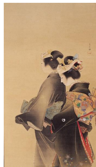
上村松園《人生の花》1899年 当館蔵