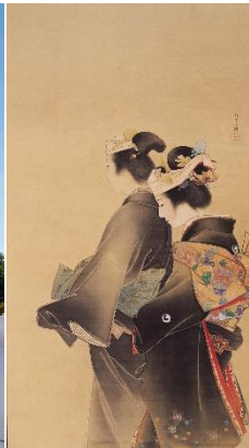
上村松園《人生の花》 1899年 当館蔵