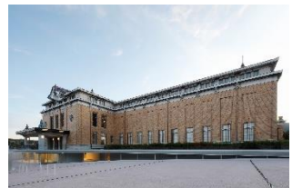
京都市京セラ美術館（内観・外観）