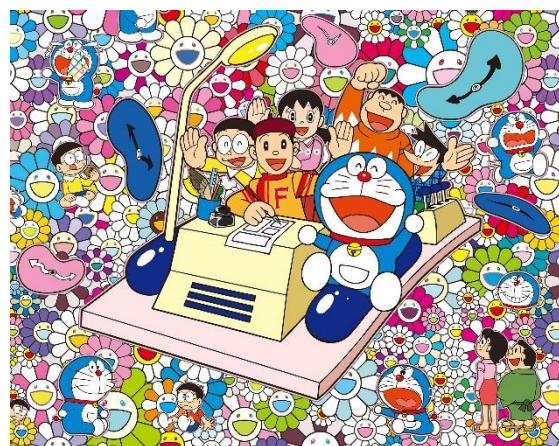
村上隆《あんなこといいな 出来たらいいな》(部分) ©2017 Takashi Murakami/Kaikai Kiki Co., Ltd. All Rights Reserved. © Fujiko-Pro

主催：京都市ほか 特別協力：藤子プロ 企画：THEドラえもん展 TOKYO 2017 実行委員会(テレビ朝日、朝日新聞社、ADK EM、小学館、シンエイ動画、小学館集英社プロダクション、乃村工藝社)