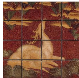
奥村霞城《鹿の図漆パネル》1937年 当館蔵

京都の市中を囲む三方の山並みが色とりどりに染まる秋には、日本屈指の近代洋画家で、京都高等工芸学校や聖護院洋画研究所（後の関西美術院）で教育者としても京都の芸術シーンに多大な影響を与えた浅井忠の名作を中心に、動植物をモチーフに海外のデザイン様式を取り入れ、斬新な作風を示した京都の名漆芸家 奥村霞城などをご紹介します、作品に織り込まれた豊かな時間をご覧ください。