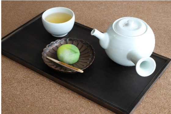
2020年春のコレクションルームにあわせた「京菓子司 金谷正廣」のコラボ和菓子。丹羽阿樹子《遠矢》をモチーフに。

ミュージアムカフェ「ENFUSE」では、安政3年創業「京菓子司 金谷正廣」による所蔵品をモチーフにした生菓子（展示にあわせて年4種）を提供し店内で召し上がっていただけます。またミュージアムショップでは伝統を重んじながら斬新な和菓子を創作する若き菓子職人「御菓子司 聚洗」による所蔵品をモチーフにした月替わりの生菓子を販売。こちらは毎月2回のみ限定販売です。（2021年度も実施予定）