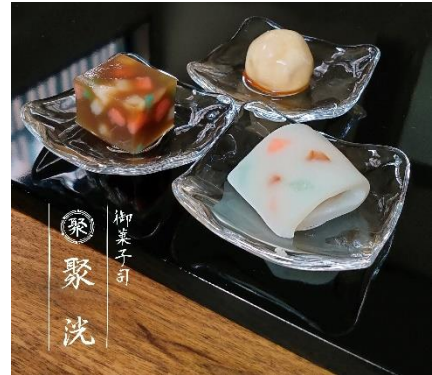
「御菓子司 聚洗」による2020年8月の生菓子。竹内栖鳳《絵になる最初》をモチーフにしている。