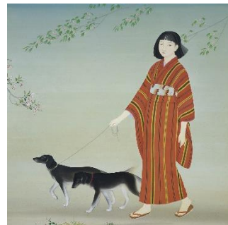
菊池契月《散策》1934年 当館蔵

当館の南側を流れる疏水の桜並木が咲き乱れ、新緑が眩しい季節には、端正な人物画を多く手がけた京都画壇の巨匠 菊池契月や、陶芸団体「赤土」を創立し、芸術活動としての陶芸制作を先駆的に模索した京焼の名工 楠部彌弐の華麗典雅な名作などを中心に、春を感じさせる品々をご覧ください。