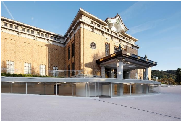
京都市京セラ美術館（外観）

京都市京セラ美術館（京都市左京区）は、2020年9月30日（水）に、2021年度の展覧会情報を公開いたしました。2021年度は、開館1周年記念展「上村松園」や、新型コロナウイルスの影響により2020年から延期となった「THE ドラえもん展 KYOTO 2021」など、近代から現代まで、多様なジャンルの展覧会で京都らしい美術館体験を提供してまいります。