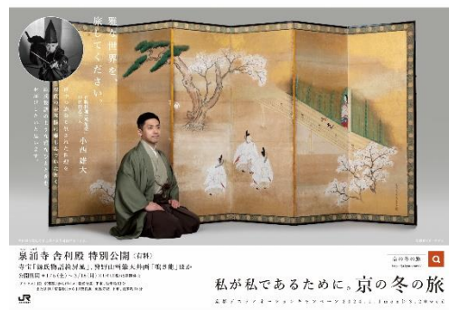
JRグループの主な駅・車内で展開するポスターの一例 ※画像はイメージです

キャンペーンに先立ち、12月の1か月間、全国のJRの主な駅に5連貼りポスターを掲出します。