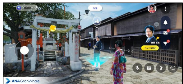
(イメージ：辰巳大明神)