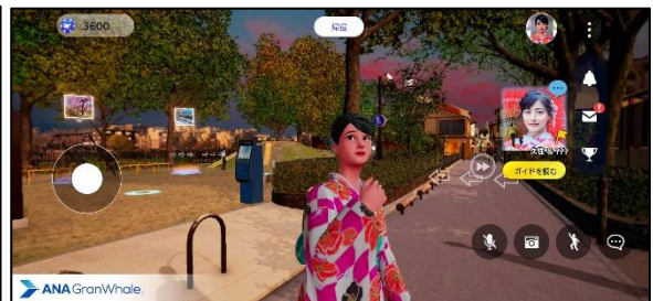
(イメージ：先斗町公園)