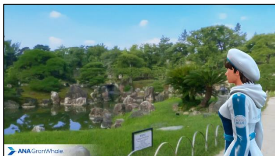
(イメージ：二の丸庭園)