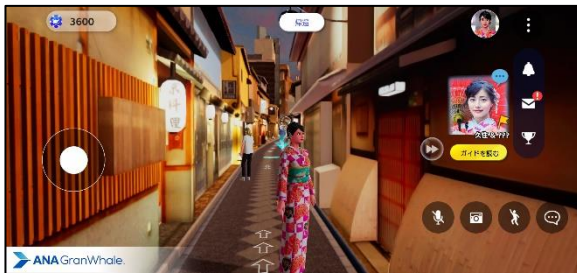
(イメージ：先斗町通)

先斗町通を3D空間で再現し、観光スポットの情報などをアプリ内のキャラクターや先斗町だけに登場する地元ガイドが案内します。地元ガイドからは地域の歴史なども聞くことができるほか、先斗町公園から南のエリアや旅の締めくくりである鴨川では夜間景観が楽しめます。