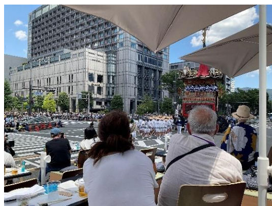
昨年(令和5年)祇園祭プレミアム観覧席の様子