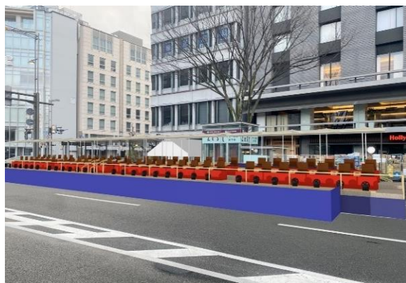
令和6年祇園祭プレミアム観覧席（イメージ）