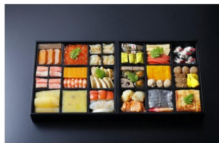
【京都吉兆】おせち 寿二段重

京都市内の星野リゾート3施設「星のや京都」「OMO5 京都三条」「OMO5 京都祇園」からお好きな宿をお選びいただき、御宿泊代として利用可能な30,000円分の宿泊券です。