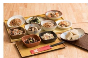
おばんざいなどの加工品