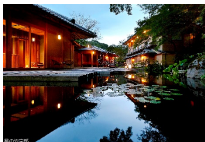
星野リゾートふるさと納税宿泊ギフト券