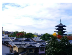
宿泊・旅行クーポン