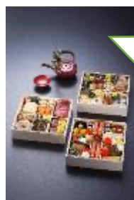
京都ホテルオークラの三重おせち