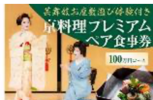
芸舞妓の舞や舞踊をはじめ、お座敷遊びを気軽に楽しめる特別プラン【寄付額100万円~120万円】