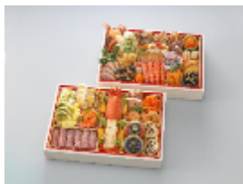
リーガロイヤルホテル京都 【限定品は初出品】