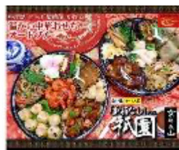
チャイナノーヴァの中華おせち 【初出品】

上記のほか、京都で人気の本格中華専門店が初登場です。和洋中が折衷したおせちや人気洋食屋さんのおせちなども選んでいただけます。