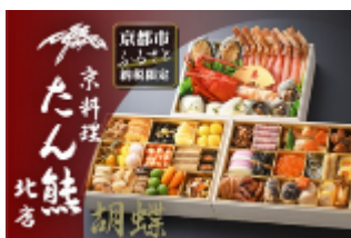
京料理 たん熊北店 【限定品は初出品】

今年度、下記の2社から特別に京都市ふるさと納税限定のおせちを出品していただきました。また、京都市と共同開発したおせちも初登場です！