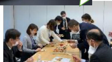
京菜味のむら×京都市 共同開発