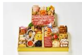
キャピタル東洋亭の洋食おせち【初出品】