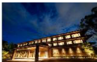
≪1日1組限定≫総本山智積院の名勝庭園を独り占めできるプラン【寄付額150万円】