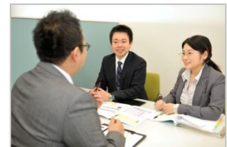
個室型ブースで経験豊富なスタッフが相続の相談に応じる(完全予約制)