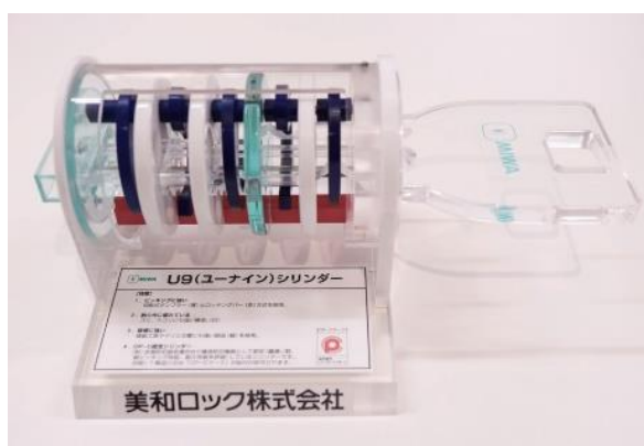
カギの内部構造

アクリルで作られた鍵の模型を展示し、その断面（内部構造）を紹介することで、鍵の開閉ができるしくみを知っていただくとともに、さまざまな部品が連動して動く様子を観察していただけます。