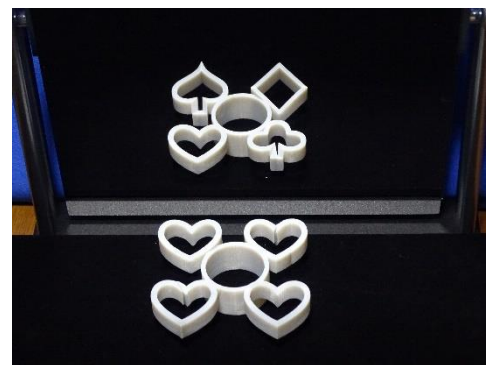
変身立体：気まぐれハート

また、様々な視点を持つことで、新しい発見や興味深い事柄や不思議をみつけやすくなることを紹介します。その一例として、変身立体を展示し、視覚的に「ありえない現象が目の前で起こっている」状況を見て、新たな不思議を感じたり、多方面から見つめて新たな発見をしたりすることで、「フシギ＝タノシイ」を感じていただきます。