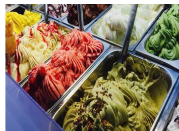
マルガージェラート

マルガージェラート HP： http://www.malgagelato.com