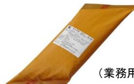
(業務用パッケージ)