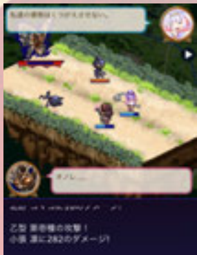
マガツヒとのバトルはクォータービューのドットバトルに!!