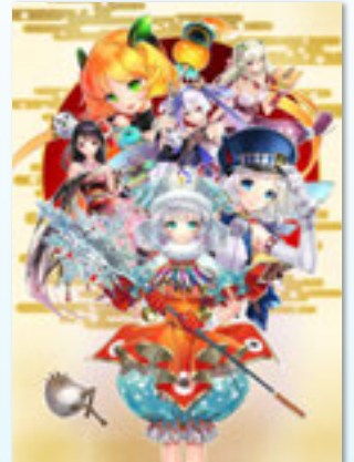
魔法少女大戦ロックオン App Storeで好評配信中