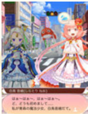
始祖の魔法少女リンドウとともに各地の魔法少女たちとのストーリーを描きます。

スタート時に登場するのは各都道府県47名の魔法少女たち。それぞれが魔法少女や普通の生活との両立に悩み、困難に立ち向かい、そして成長していきます。プレイヤーは彼女たちとともに、各地で発生するマガツヒ発生に対応しながら、異変の謎の迫ります。彼女たちの向かう先には何があるのか。アニメとの連動も予定されており、展開には目が離せません!