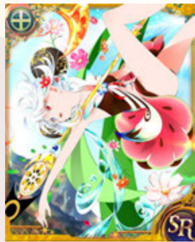
『魔法少女大戦タクティクス』の事前登録受付期間は、2014年1月27日12時までとなりますのでご注意ください。

今ならスペシャル特典付き事前登録受付中! 熊本の魔法少女・有明煉華のSRをゲット!!