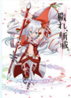
魔法少女大戦Zanbatsu(仮称) 2014年3月27日PlayStation®Storeにて無料配信予定 ©2.5次元てれび/GALAT