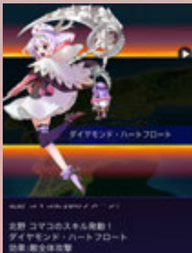
特定の条件下ではスキルが発動。派手なカットインとともに必殺技が炸裂!

今ならスペシャル特典付き事前登録受付中! 熊本の魔法少女・有明煉華のSRをゲット!!