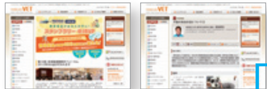
WEB (Promiclos VET)

商品カテゴリ別、商品は 11,000 点以上！ (医薬品、フード/サプリ、総合カタログ(医療材料ほか))