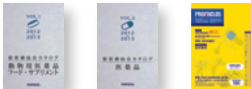
獣医療総合カタログ

商品カテゴリ別、商品は 11,000 点以上！ (医薬品、フード/サプリ、総合カタログ(医療材料ほか))