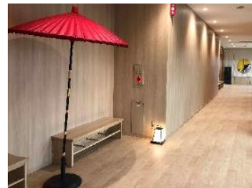
<「ほんだし®」見学コース(一部)>

味の素グループは、“Eat Well, Live Well.”の実現に向け、今後も生活者に安心して召し上がっていただける製品を安定的にお届けできるよう、バリューチェーンの強化を図り、生活者の「食」と「健康」に貢献し続けます。