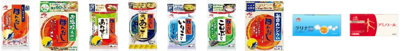
<味の素食品(株)三重工場の主な生産品目>

当社は目指す姿を「食と健康の課題解決企業」と定め、その実現へ向けて国内食品の生産体制再編を進めています。この取り組みの一環として、国内調味料・加工食品の生産を担う新会社、味の素食品(株)を2019年4月に発足させ、国内工場を段階的に集約する構造改革を進行中です。本工場はこの計画において竣工する最初の工場であり、包装を担っていた関西工場の機能を同工場に移管・集約し、「ほんだし®」の製造・包装一貫生産を実現します。また、この工場では「グリナ®」、「アミノエール®」等成長領域であるサプリメントも生産します。