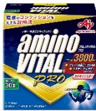
「アミノバイタル® プロ」