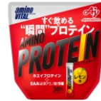
「アミノバイタル® アミノプロテイン」 レモン味