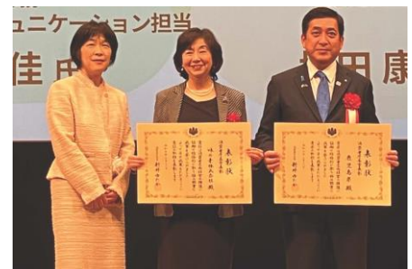
左：消費者庁長官 新井 ゆたか氏 中央：当社執行役常務 森島 千佳 右：鹿児島県知事 塩田 康一氏 (表彰式にて)

(2025年1月24日消費者庁発表ウェブサイトより) 消費者志向経営推進組織の活動 | 消費者庁