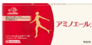
生産している主な製品