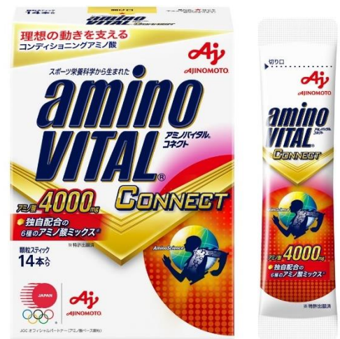
「アミノバイタル®CONNECT」 ＜14本入箱＞

日本代表選手団だけでなく、幅広い層のアスリートから一般の方までお使いいただけるよう、2021年10月8日(金)より一般発売します。