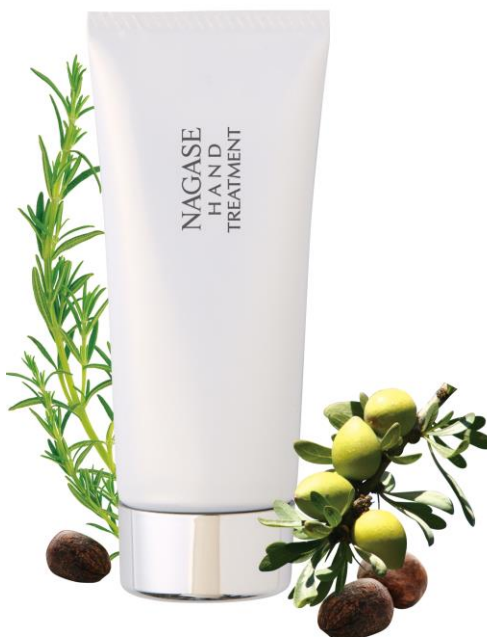
ナガセ ハンドトリートメント 50g 2,800円(税込)

微香性で、軽やかなハーバルフローラルの香り。家事や仕事の合間、お風呂あがり、お休み前など、日常のさまざまなシーンでご使用いただけます。また、マッサージをプラスすることで血行が促進され、より効果的な手肌ケアが実感できます。