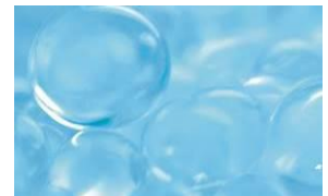
※セラミドファンクション(イメージ)