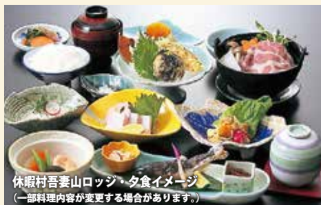
休暇村吾妻山口ロッジ・夕食イメージ (一部料理内容が変更する場合があります。)

行程 庄原市役所 (10:00発) = 比婆山古道入口 … 御陵 … 烏帽子山 … 大膳原 (途中・昼食《登山弁当》) … 吾妻山 … 休暇村吾妻山口ロッジ (夕食) = 庄原市役所 (18:50頃着)