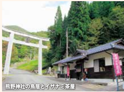
熊野神社の鳥居とイザナミ茶屋