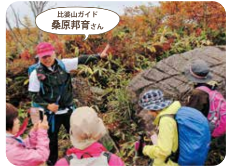
比婆山を熟知する地元ガイドが同行します。