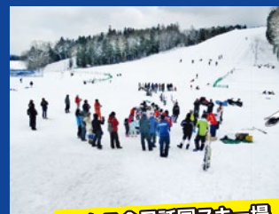
りんご今日話国スキー場