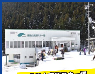
道後山高原スキー場