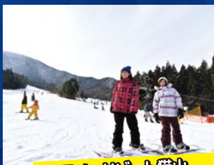
スノーリゾート猫山