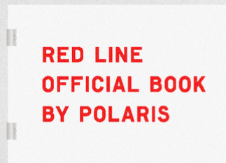
D Red Line Official Book