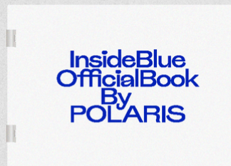
D Inside Blue Official Book