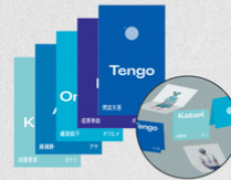
C Character Cards