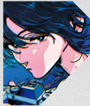
A Inside Blue