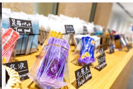
アメニティバイキング