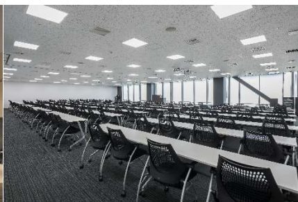
カンファレンスルーム