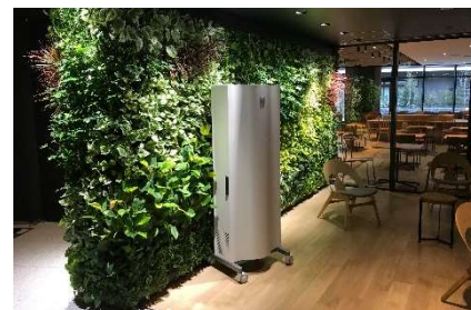
GENANO ® 5250A

※メーカーテスト結果として、ウイルス抑制(25 m 3 密閉空間において風量 40 m 3 /h で稼働し、416 分後 99%抑制) 菌抑制(25 m 3 密閉空間において風量 40 m 3 /h で稼働し、388 分後 99%抑制)の効果検証。