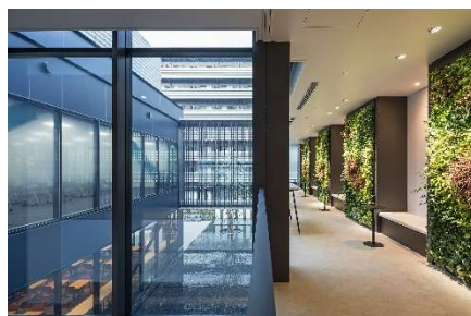
ラウンジ(休憩スペース)