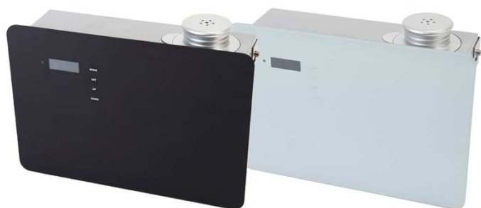
50畳までのスペース用