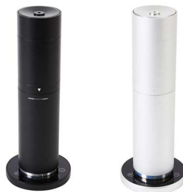
30畳までのスペース用