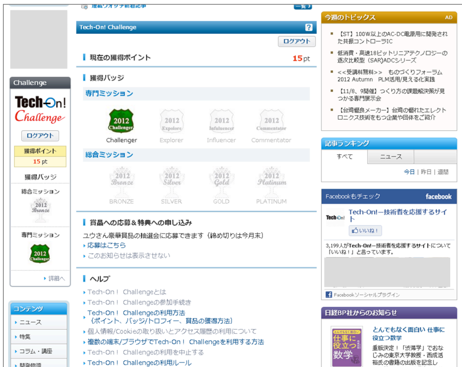
各ミッションの達成状況

アクセルユニバースでは、“Tech-On! Challenge”におけるゲーミフィケーション機能の設計、コンサルティングを提供させて頂きました。