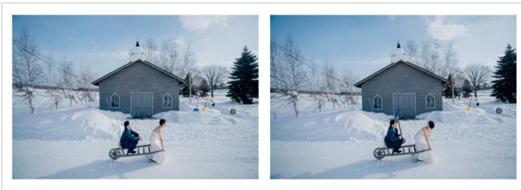
タイトル：結婚、北海道移住記念 [アルバム] 受賞者：木下 令 (トップフォトグラファー) https://photo.decollte.co.jp/staffs/6