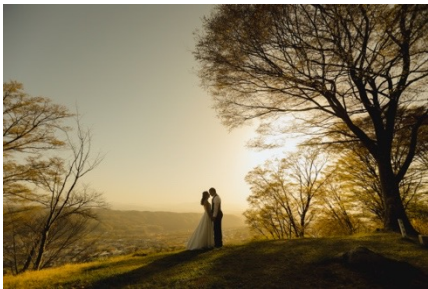
タイトル：夕暮れの優しい光に照らされて 受賞者：山村 祐太（スタジオAQUA 新宿店） https://photo.decollte.co.jp/staffs/78