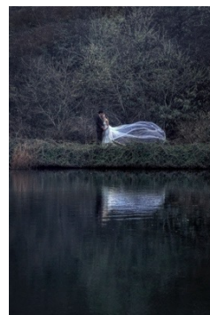
タイトル：静寂と風 受賞者：高山 政幸 （スタジオTVB 神戸ハーバーランド店） https://photo.decollte.co.jp/staffs/317