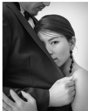
タイトル：秘密 受賞者：渡邊 浩太（シニアフォトグラファー） https://photo.decollte.co.jp/staffs/44