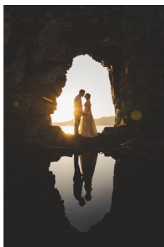
タイトル：水面 受賞者：前崎 浩海（スタジオAQUA 立川店） https://photo.decollte.co.jp/staffs/334