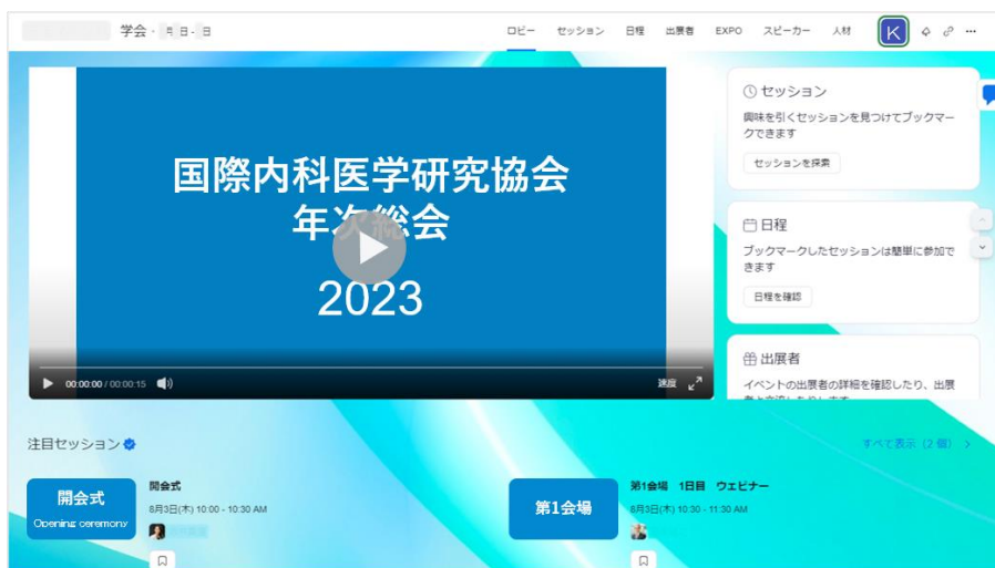
「Zoom Events」でのイベント開催イメージ（ロビー）