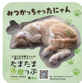
たまたま多摩ちゃん オリジナルステッカー

https://www.city.kawasaki.jp/tama/page/0000128812.html