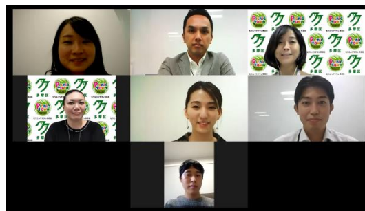
「イージオス」とのイベントMTGの様子

今回、多摩区からご依頼を受け、僕たちの普段の活動が少しでも多摩区の役に立てればと思い、参加させていただきました。これまで文章題での早押しクイズをメインに作成・回答してきたので、謎解きの作成はほとんど初めてでしたが、知恵を振り絞って作問や添削に協力させていただきました。新型コロナウイルス感染拡大による大学キャンパスの閉鎖に伴い、現在当サークルではオンライン上での活動がメインとなり普段通りの活動ができずにあります。そのような状況の中で、今回新しい活動の機会をいただけて大変嬉しく思います。 このようなご時世ですが、今回のこの機会を通して1人でも多く笑顔をお届けできればと会員一同願っています。