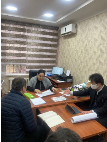
タシュケント6番学校／校長