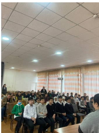
タシュケント6番学校／セミナー (保護者・数学講師・生徒)