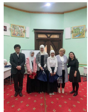
オリентスクール表彰式