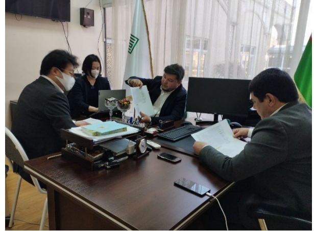
タシュケント オリентスクール校長