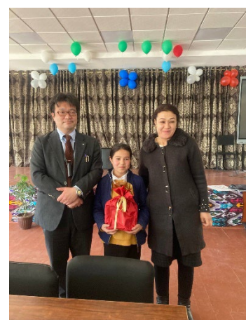
タシュケント6番学校 成績上位 TOP1 生徒と保護者★