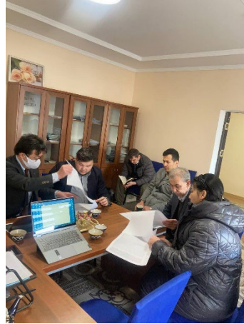
ブハラ1番学校／副校長