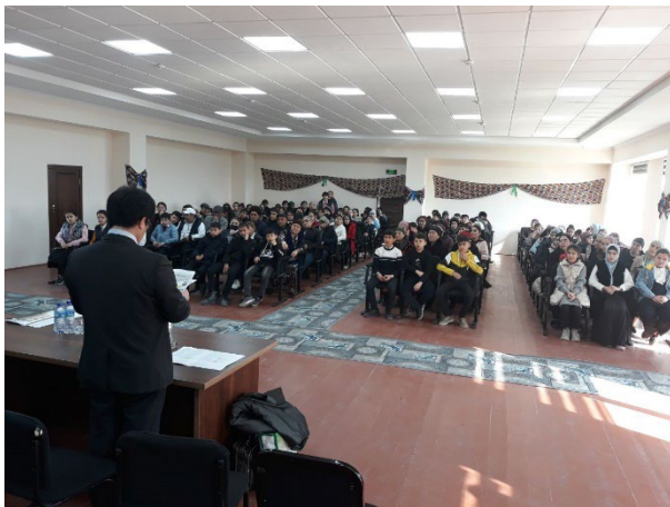
ブハラ1番学校／セミナー(保護者・数学講師・生徒)