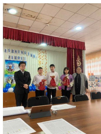
タシュケント6番学校／表彰式