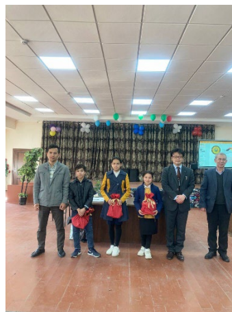
ブハラ1番学校／表彰式