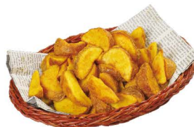
ピザだけじゃない！ スープカレー味のポテトなど サイドメニューも充実！