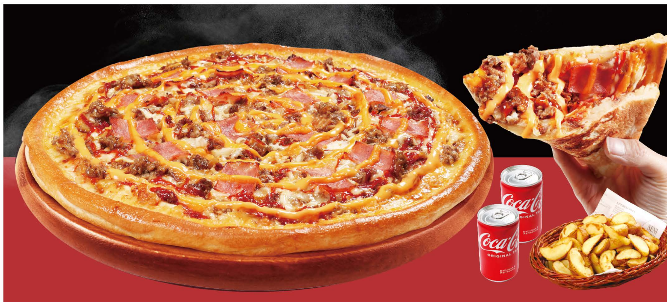
北海道ビーフピザバーガー+北海道フライドポテト+コカ・コーラ