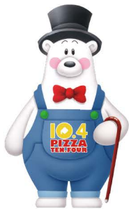
テン.フォー 公式マスコットキャラクター “しろくま男爵”