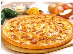
北海道カントリー男爵など 道産食材を使ったメニューも 多数取り揃えております。