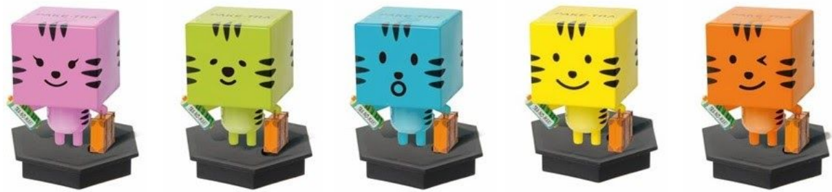
画像：フィギュアスタンド部分のみを取り外して並べたイメージ

元来、フィギュア付きの蓋を作成する場合、蓋の型からオリジナルでオーダーいただく必要がありました。しかし「フィギュアリッド」の登場により、フィギュア部分の金型代のみで実現できます。