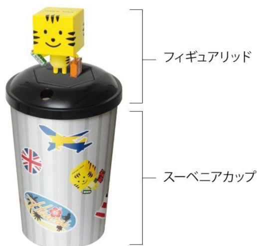
画像：スーベニアカップにフィギュアリッドを装着した様子

イベント会場で販売されるドリンクが、集めたくなるプレミアムなアイテムにランクアップ!