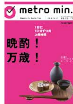
「メトロミニッツ」刷新後の表紙イメージ