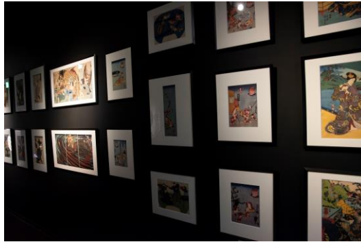
アートアクアリウム美術館 GINZA 館内 浮世絵展示エリア

江戸の人々の生活や社会が垣間見れる題材を、ユーモアとシニカルにあふれる作風で表現した彼の世界観は、まさに江戸のポップアートといえるでしょう。