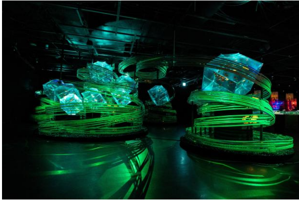
隈研吾氏コラボレーション作品 「金魚の石庭」

2022年5月に銀座三越に誕生した「アートアクアリウム美術館 GINZA」は、年間を通して四季の移ろいをお楽しみいただける常設施設です。開業時以来、毎年水槽作品の入替などを行っており、アートアクアリウムを代表する作品や、銀座開催にて初披露となる新作の展示など、様々なアートアクアリウム作品をご覧ください。