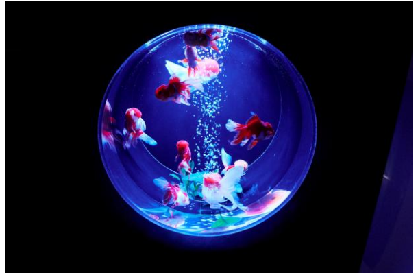
「金魚コレクション」