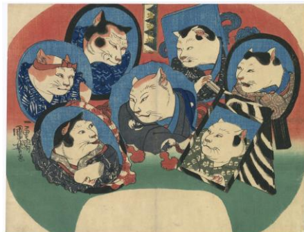
猫の百面相 忠臣蔵

「猫の百面相」は、猫になった役者たちの「仮名手本忠臣蔵」七段目を描いた作品です。