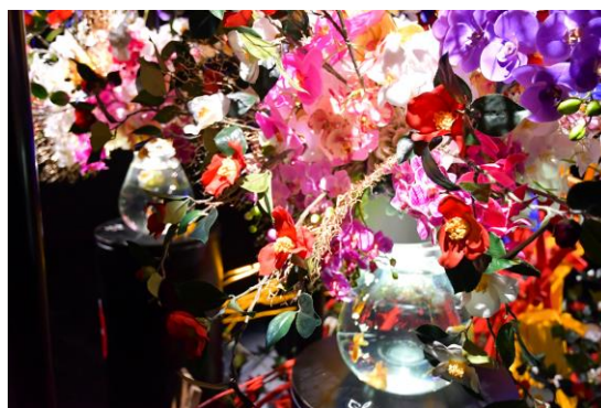
ツバキが彩る“フラワーリウム”