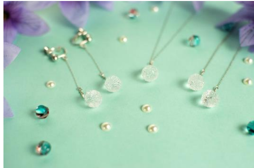
「鞠」（ピンポンパールモチーフ）