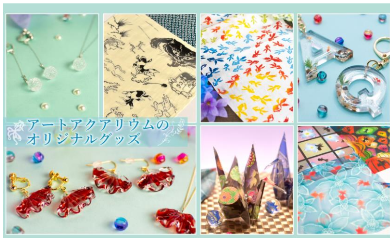
アートアクアリウムの オリジナルグッズ

当館へご来館いただいた際には、ぜひミュージアムショップでのお買い物もお楽しみください。