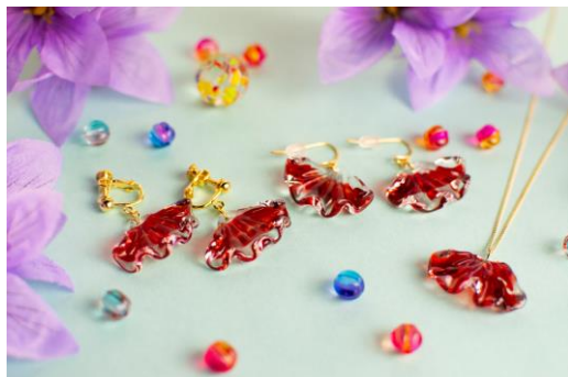
「華」（土佐金モチーフ）