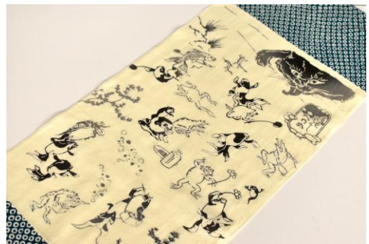
「てぬぐい 金魚づくし」