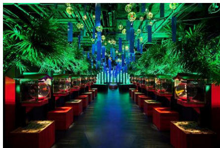
提灯リウム×風鈴 ※画像は昨年のものです