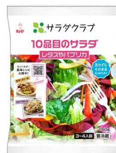
10品目のサラダ レタスやパプリカ

「10品目のサラダ レタスやパプリカ」（160g/税込306円）は、10種類の野菜がバランス良く配合された、3～4人前の「10品目のサラダシリーズ」の定番商品です。レタスやロメインレタスをメインに、赤パプリカ、人参、レッドキャベツやトレビスを彩り良く配合しています。本商品は、“10種類の野菜を彩りよく一皿に”をコンセプトに、2004年から販売を開始し、当社の主力商品「千切りキャベツ」「ミックスサラダ」に次ぐ人気のサラダです※。※2020/09/01～2021/08/31の売上実績より