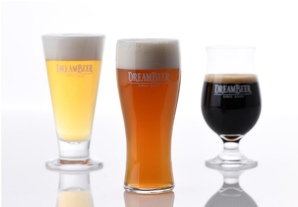
「DREAMBEER オリジナルビアグラスセット」