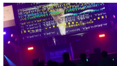
粗品(バーチャル出演)による初の DJ プレイ