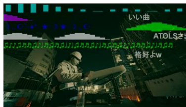
ATOLS が渋谷でサイレント野外 DJ