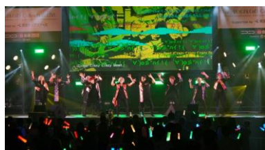
ボカロの音楽祭「ボカコレライブ」

ライブ、ボカロ P 対談、クリエイター応援企画やボカロ動画ランキングなど、ボカロづくしの2日間を実施