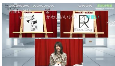
リモートでのボカロ P 対談