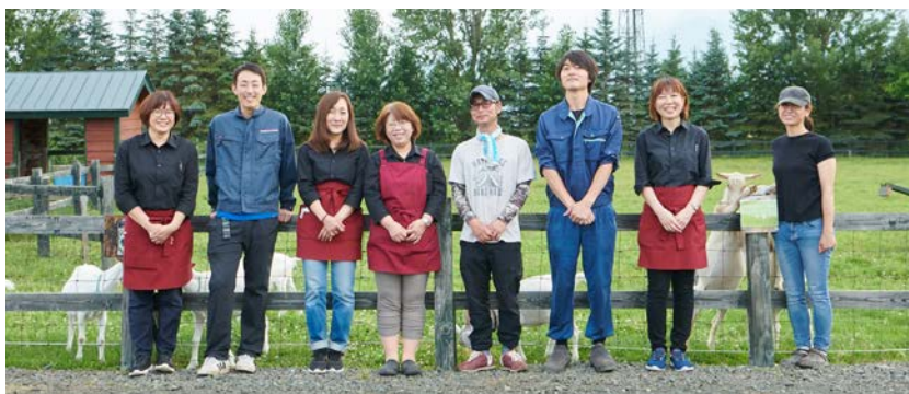
ドメヌレゾンのスタッフ

2018年設立。北海道富良野エリア(中富良野/富良野)に40ヘクタールの自社圃場をもつ、持続可能なエネルギーの循環「サスティナブル」をモットーにした新進気鋭のワイナリー。人間と自然が共存できる環境での、ブドウ栽培やワイン造りをおこなっています。ワイナリーの敷地内には、ドメヌレゾンが提案する「サスティナブル」を表現したワインを販売するブティックや、ヤギミルクを使ったソフトクリームやパフェ、スムージなどを味わえる「グリル&農家レストランやぎカフェ」が併設されており、カフェのテラス席からは、絶景の十勝岳を一望でき、ゆったりとした時間を楽しめます。