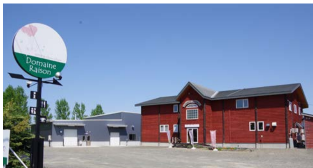
北海道空知郡中富良野町に位置する、2018年設立のドメヌレゾン